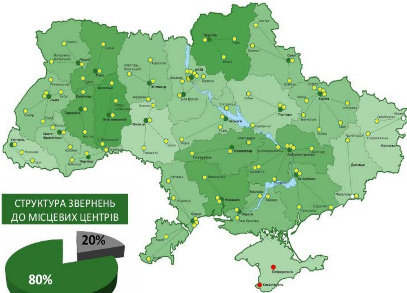
СТРУКТУРА ЗВЕРНЕНЬ ДО МІСЦЕВИХ ЦЕНТРІВ